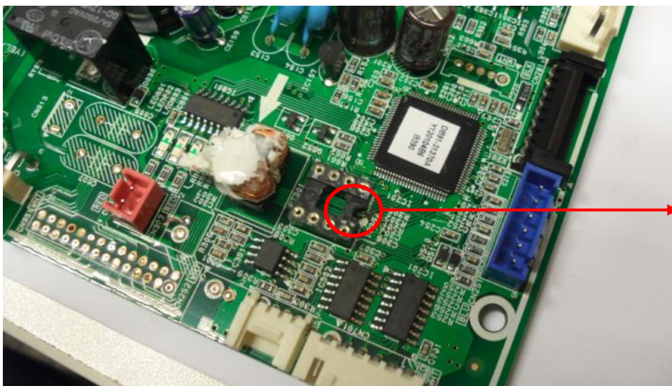
Posição do Chanfro do SOQUETE